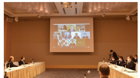
オンラインで意見交換会を初開催

協力金などの早期支給、GoTo事業の再開と期間延長、ポストコロナに向けた中小・小規模事業者の経営支援に係る商工会議所の体制強化などを求めた。会合では、感染防止と社会経済活動両立のため、商工会議所と全国知事会、都道府県が連携を強化し、地域経済社会を底上げしていくことなどで一致した。