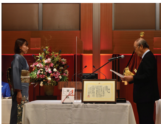
「女性起業家大賞」最優秀賞受賞者を表彰する日商の三村会頭