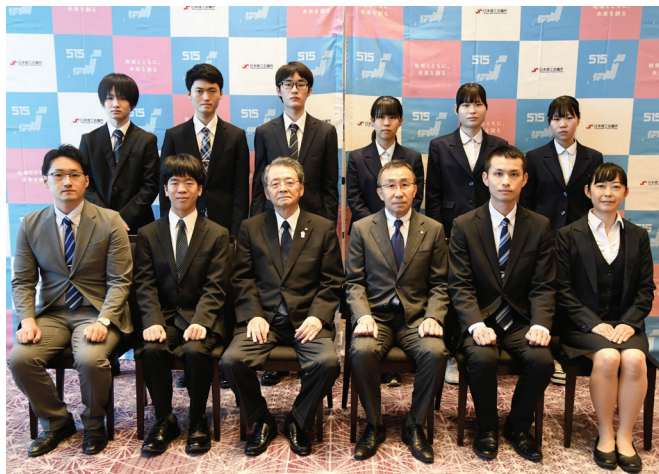
2024年度最優秀者を表彰