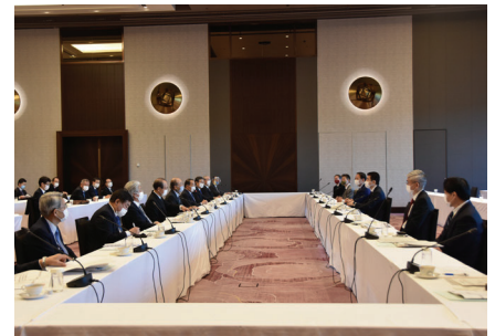
商工会議所関係者は野上大臣（写真左）らと中身の濃い議論を展開した