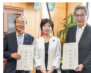
(左から) 矢口専門委員長、鰐淵副大臣、小山田専門委員長