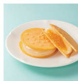
瀬戸内の八朔 せとこまち