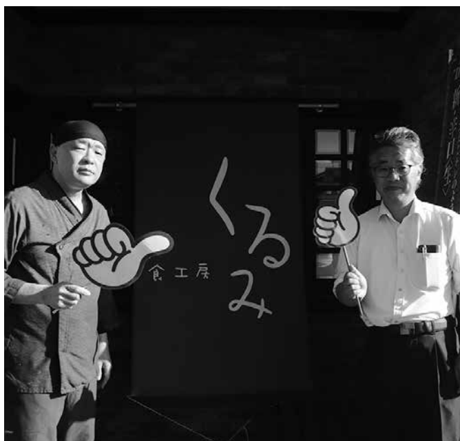
丸山店主(左)と森川経営指導員(右)

飲食店を経営していると、様々な課題に直面します。いつでも気軽に、親身に乗っていただける商工会議所は、とても心強く頼りになる存在です。これからも引き続きよろしくお願い致します。