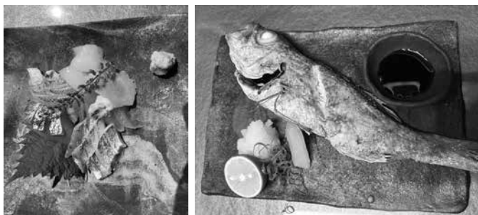
一品一品こだわり抜いた料理を提供します

また、コース料理(4名様から要予約)は、一つ一つ丁寧に作られた、季節を感じていただけるおすすめの内容となっております。