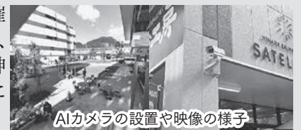
AIカメラの設置や映像の様子

既にイベントでの利用を試験的に実施。参考データとして2件(12月開催ミハラゴーマルシェ、2月開催エキマエ神明市)を関係箇所へ提出しました。