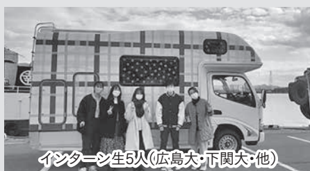
インターン生5人(広島大・下関大・他)

【成果】本インターンには5人募集のところ、全国から31人関心があり、8人の応募につながるなど、都市部からの移住定住を考える際に、UIJターン先の候補として関係人口となる三原市を選択するケースにつながるきっかけとなりました。また、5人のインターン生により4つの事業を着手することができました。