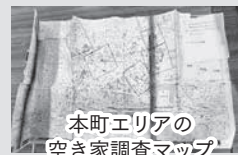
本町エリアの 空き家調査マップ