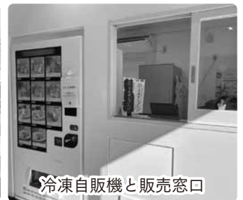
冷凍自販機と販売窓口