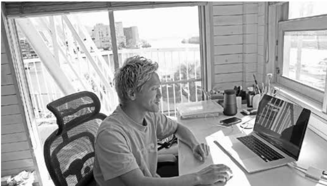
瀬戸内海の景色を一望できる事務所は、自身のお気に入り

独立するにあたっては、これまで仕事で関わってきた方々とのお付き合いも続くことから、不安よりかはワクワク感の方が大きかったかもしれません。