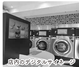
店内のデジタルサイネージ

リレーベースとは、「繋がり・中継」と「拠点」という意味合いを込めた造語で、この拠点を基軸として三原のまちを知るきっかけとなり、来街者が増えるような仕掛けづくりをこれから行っていきます。