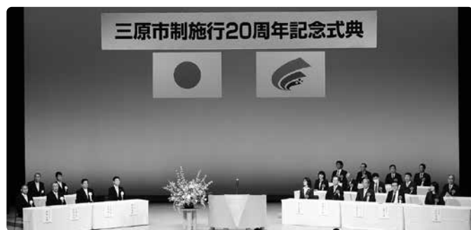
三原市制施行20周年記念式典

三原市は、平成17年3月22日の1市3町の合併から、今年で市制施行20周年を迎え、5月17日(土)、三原市芸術文化センターポポロにおいて、市制施行20周年の記念式典が挙行され、本所森光会頭も来賓として出席しました。