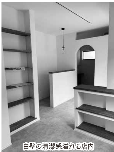
白壁の清潔感溢れる店内

移転後に店名を「温活サロン温と。」へ変更しましたが、この名前は、三原商工会議所青年部会のネーミング講座でアイデアを頂き、「『温』をもっと身近に気軽に。」という当店のコンセプトにぴったりだと思い決定しました。