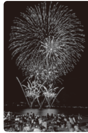
2024やさ花火フェスタ

第50回記念三原やさ祭りの最終日は、2025やさ花火フェスタで三原の夜を彩ります。三原の夜空を舞台に、華やかな花火が祭りの感動を最高潮へと導きます。