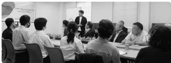
森山社長から説明を受ける参加者

にデジタル技術を活用して経営を変革しているのか?!その具体的な取組みや成功のポイントについて意見交換も行い、視察参加者からは、「身近に取り入れられるヒントがある」といった、業務改革に向けて前向きな感想も聞かれ、とても有意義な視察見学会となりました。