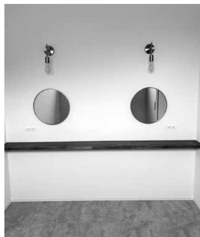
2人で施術可能なスペースもあり、親子・友人・カップルでの来店もおすすめ