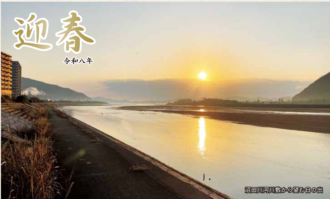
沼田川河川敷から望む日の出